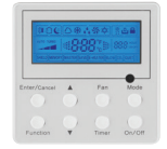
THERMOSTAT (Facultatif) XE71